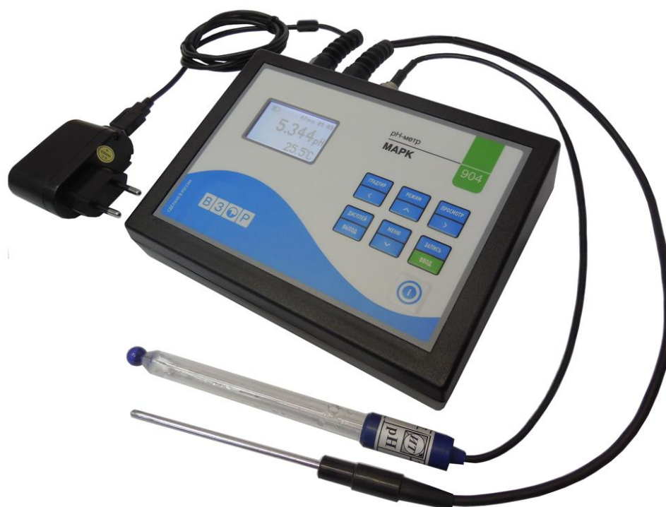
Рисунок 1 - Общий вид рН-метра