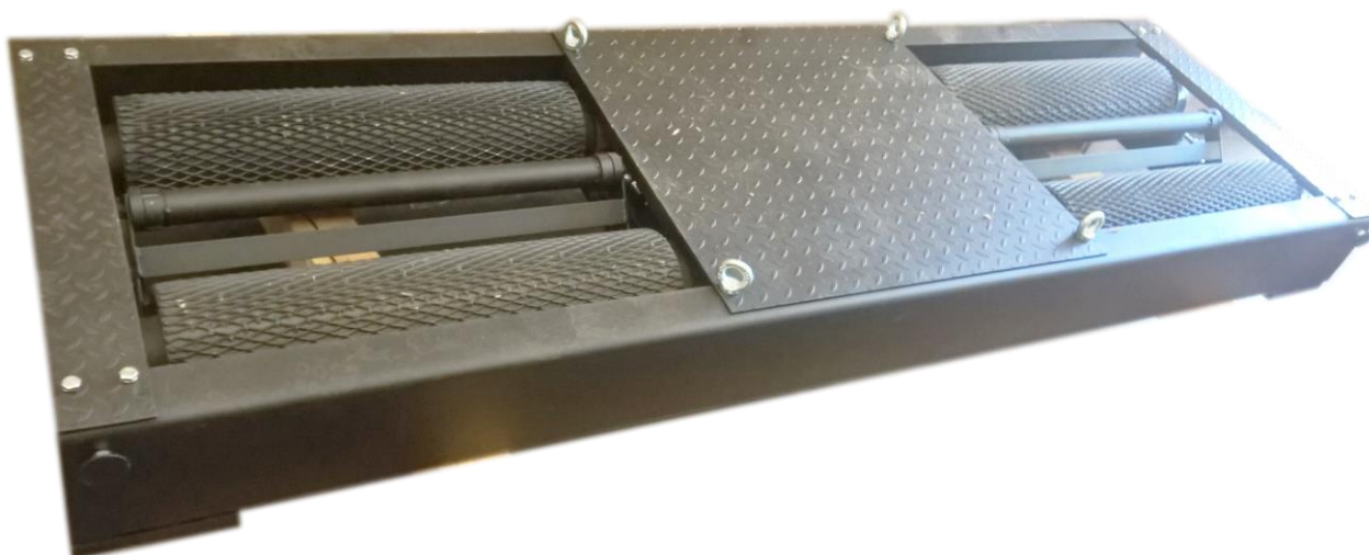
Рисунок 1 – Общий вид стенов тормозных РЕМСТО-ТС-3-1С-1-3Ч