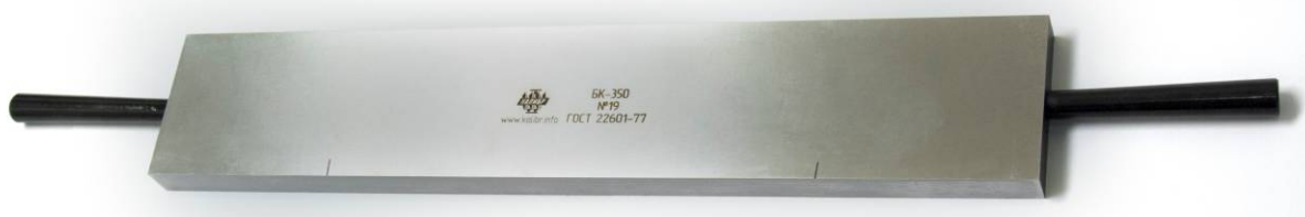
Рисунок 1 - Общий вид брусков контрольных

На боковые поверхности бруска контрольного нанесены риски, отмечающие точки наименьшего прогиба, на которые брусок контрольный устанавливается на поверочной плите перед началом работы.