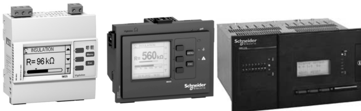
Рисунок 1 - Общий вид систем контроля сопротивления изоляции Vigilohm (слева направо IM10, IM20, IM10H, IM20H; IM400; XML308, XML316, XL308, XL316, XM300C)

Схема пломбирования от несанкционированного доступа, обозначение места нанесения знака поверки представлены на рисунке 2.