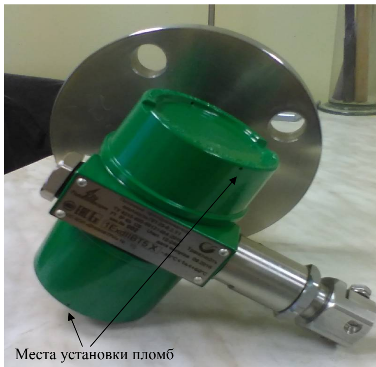
Рисунок 3 - Схема пломбировки от несанкционированного доступа