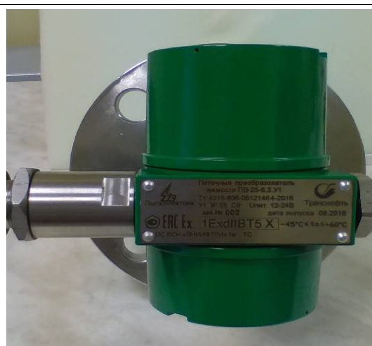
Рисунок 2 - Общий вид преобразователя ПВ-25-6,3.У1-Вн (маркировка)