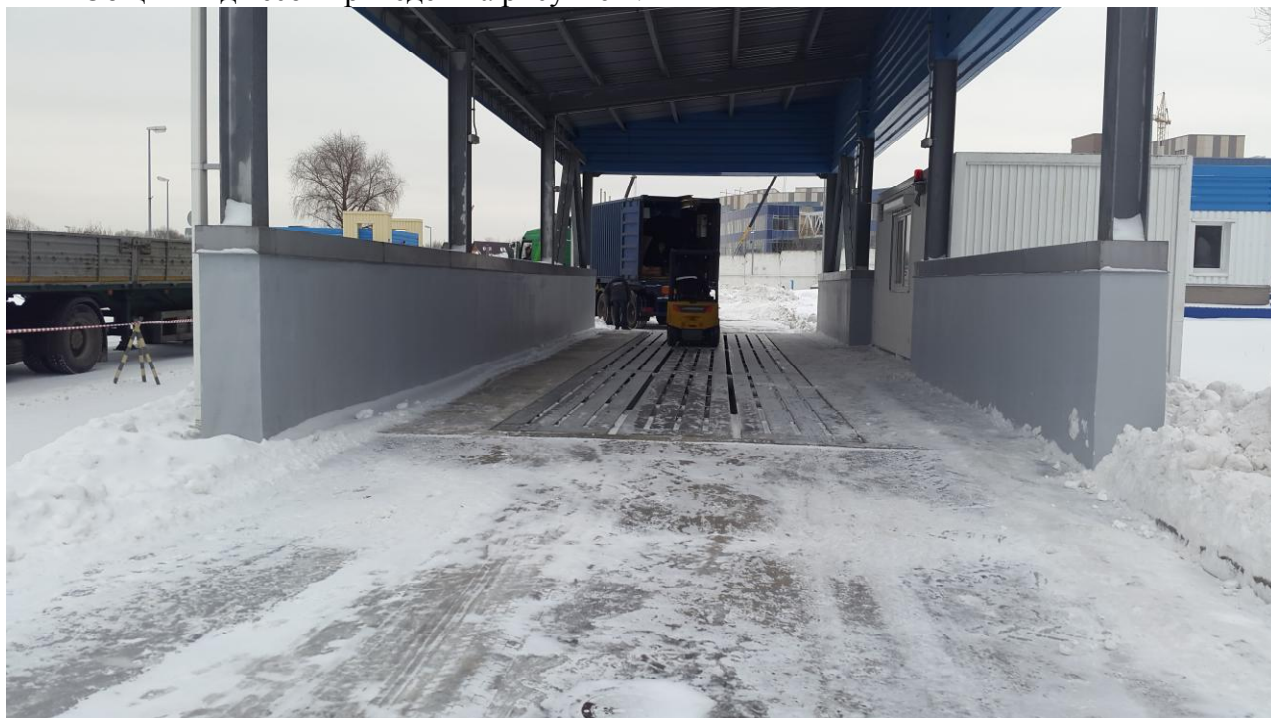
Рисунок 1 - Общий вид весов модульных стальных MSW