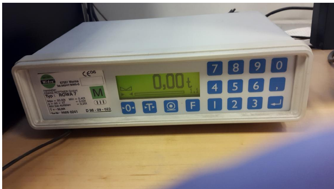
Рисунок 2 - Общий вид индикатора «ROWA 7»

На рисунке 2 приведен общий вид индикатора «ROWA 7».