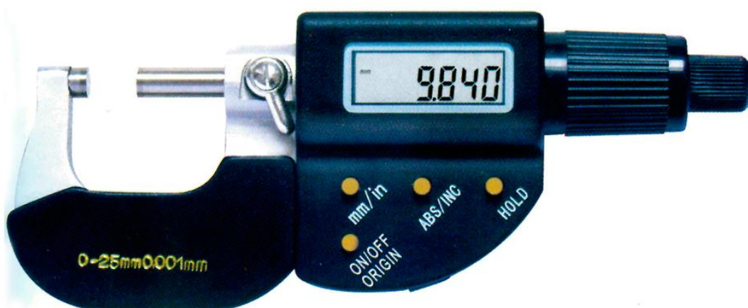
Рисунок 6 - Общий вид микрометров с цифровым отсчетным устройством