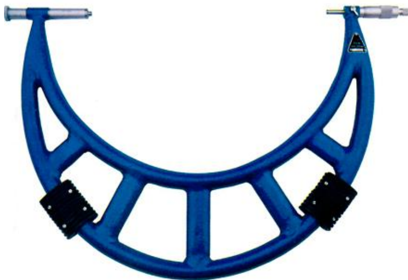
Рисунок 4 - Общий вид микрометров с отсчетом по шкалам стебля и барабана