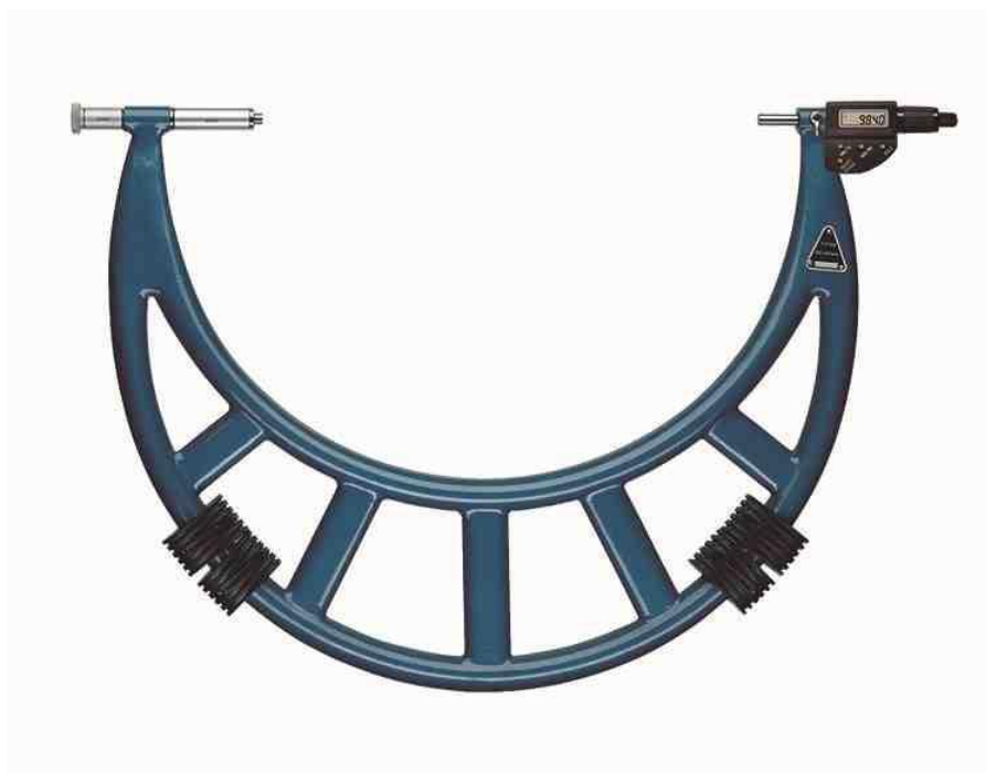
Рисунок 10 - Общий вид микрометров с цифровым отсчетным устройством

Пломбирование микрометров гладких торговой марки «SHAN» не предусмотрено.