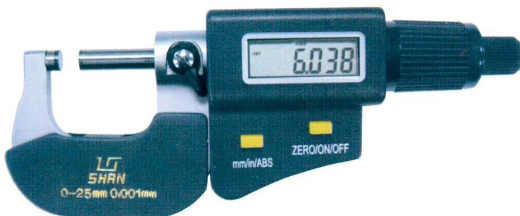
Рисунок 5 - Общий вид микрометров с цифровым отсчетным устройством