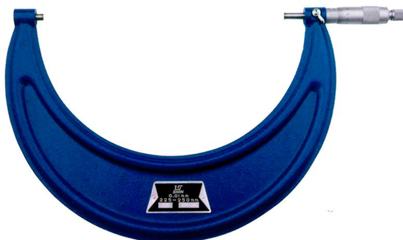
Рисунок 3 - Общий вид микрометров с отсчетом по шкалам стебля и барабана