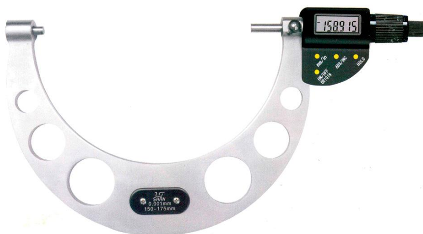
Рисунок 8 - Общий вид микрометров с цифровым отсчетным устройством