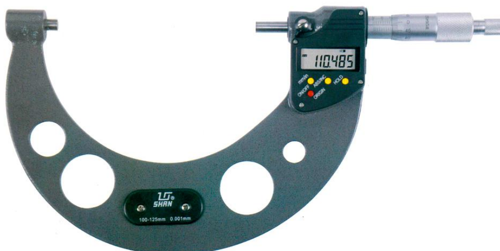
Рисунок 9 - Общий вид микрометров с цифровым отсчетным устройством