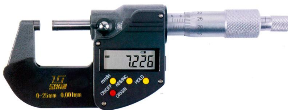
Рисунок 7 - Общий вид микрометров с цифровым отсчетным устройством