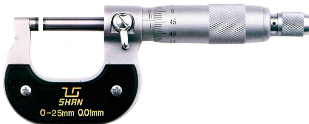
Рисунок 1 - Общий вид микрометров с отсчетом по шкалам стебля и барабана