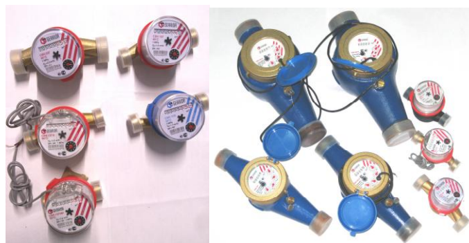
Рисунок 1 - Общий вид счетчиков воды крыльчатых СВК, СВКМ

Общий вид счетчиков воды крыльчатых СВК, СВКМ представлен на рисунке 1.