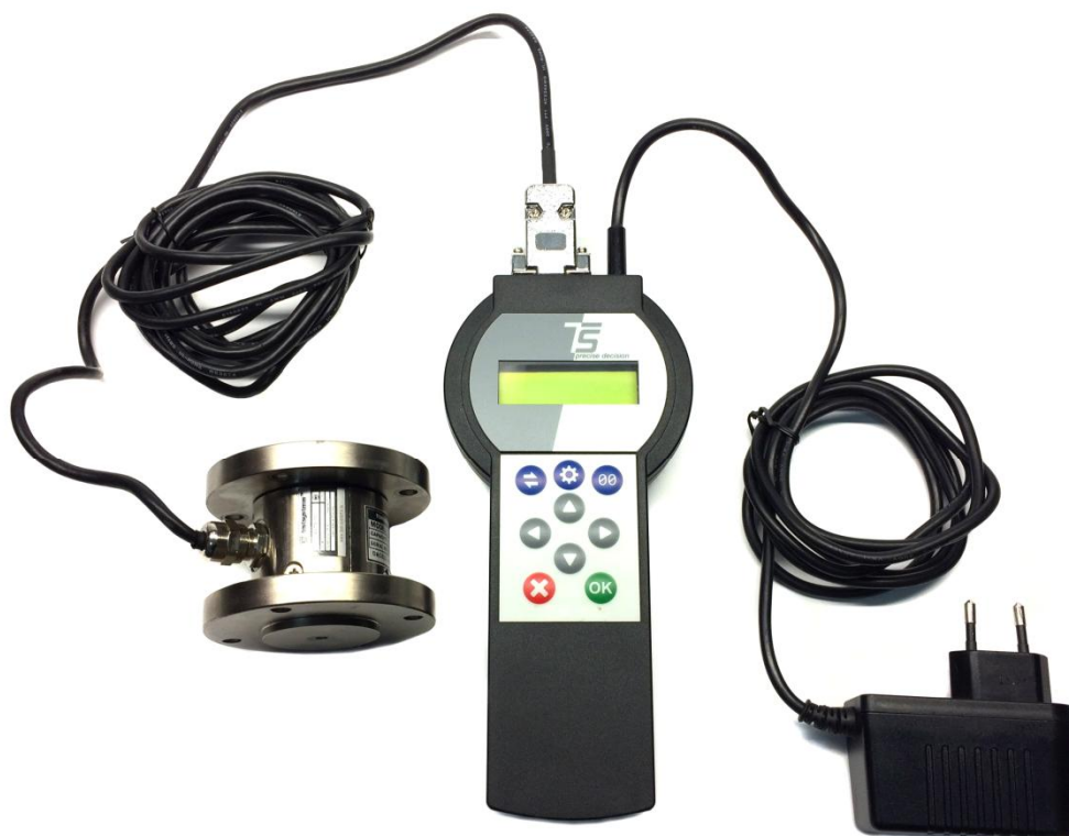
Рисунок 1 - Общий вид средства измерений