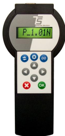
Рисунок 2 - Внешний вид пульта оператора с изображением версии программного обеспечения