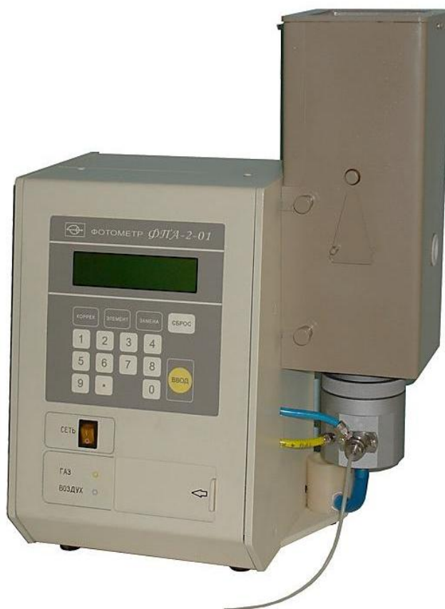
Рисунок 1 - Общий вид оптико-электронного блока фотометра ФПА-2-01

Схема пломбировки от несанкционированного доступа, обозначение места нанесения знака поверки представлены на рисунке 2.