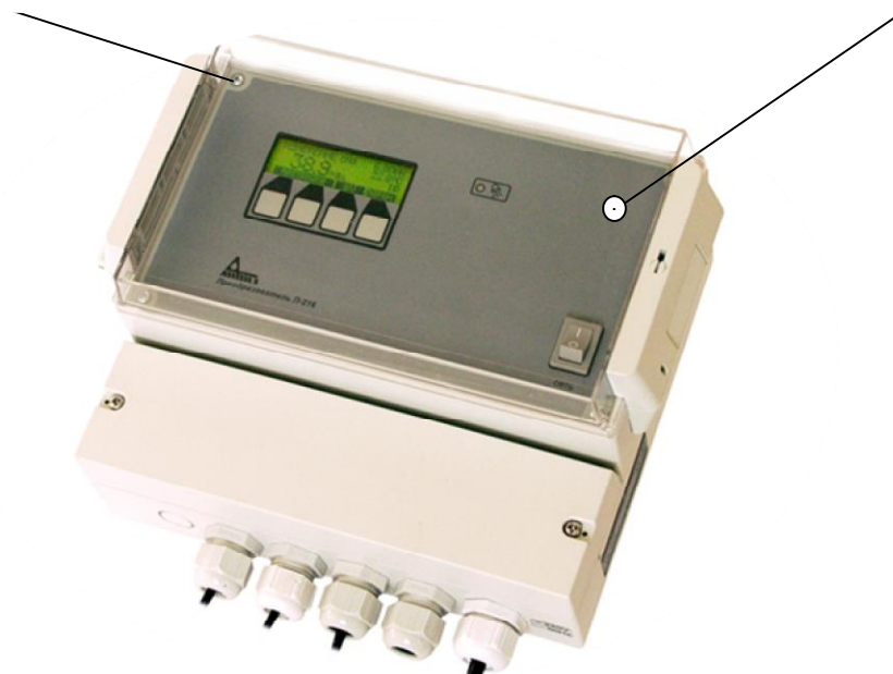
Рисунок 3 - Схема пломбировки от несанкционированного доступа и схема нанесения знака поверки на преобразователи со встроенным входным усилителем

Место пломбировки от несанкционированного доступа