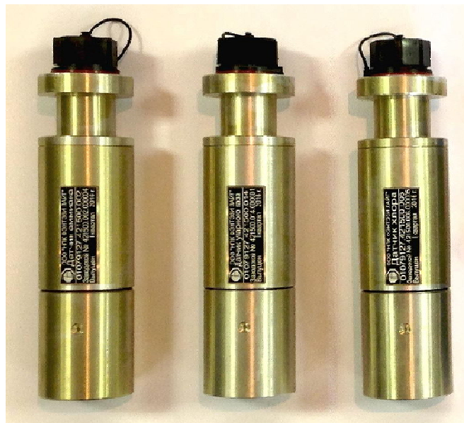
Рисунок 2 - Выносные датчики прибора БСХД-03-У