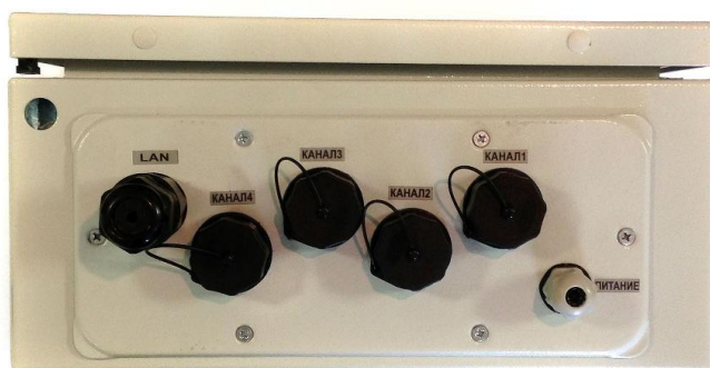
Рисунок 3 - Блок управления вид снизу