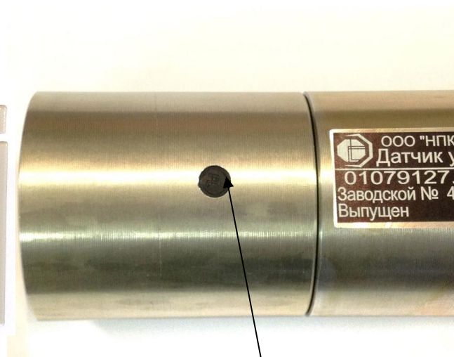
Рисунок 4 - Место пломбирования датчика