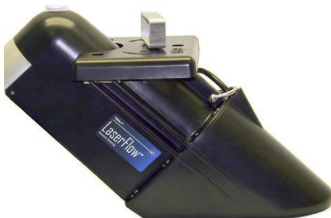
Рисунок 2 - Комбинированный бесконтактный датчик TIENet 360 (LaserFlow)