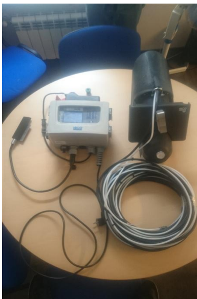
Рисунок 1 - Общий вид расходомера ISCO Signature LaserFlow

Комбинированный бесконтактный датчик TIENet 360 (LaserFlow) имеет неразъемный корпус, поэтому пломбирование не производится. Пломбирование электронного блока производится путем установки пломбы на замке крышки корпуса.