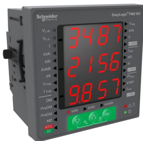
Рисунок 2 - Счетчики серии PM2100