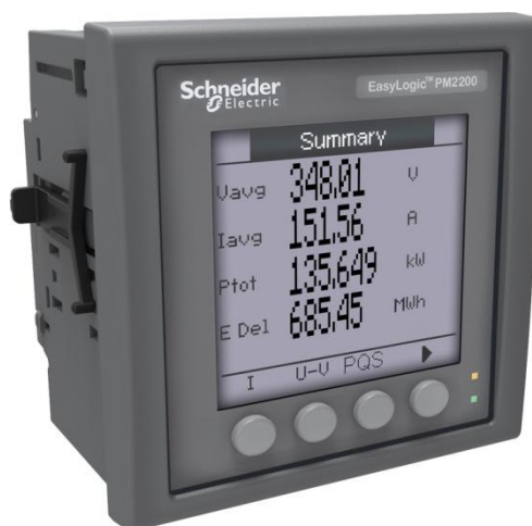
Рисунок 1 - Счетчики серии PM2200