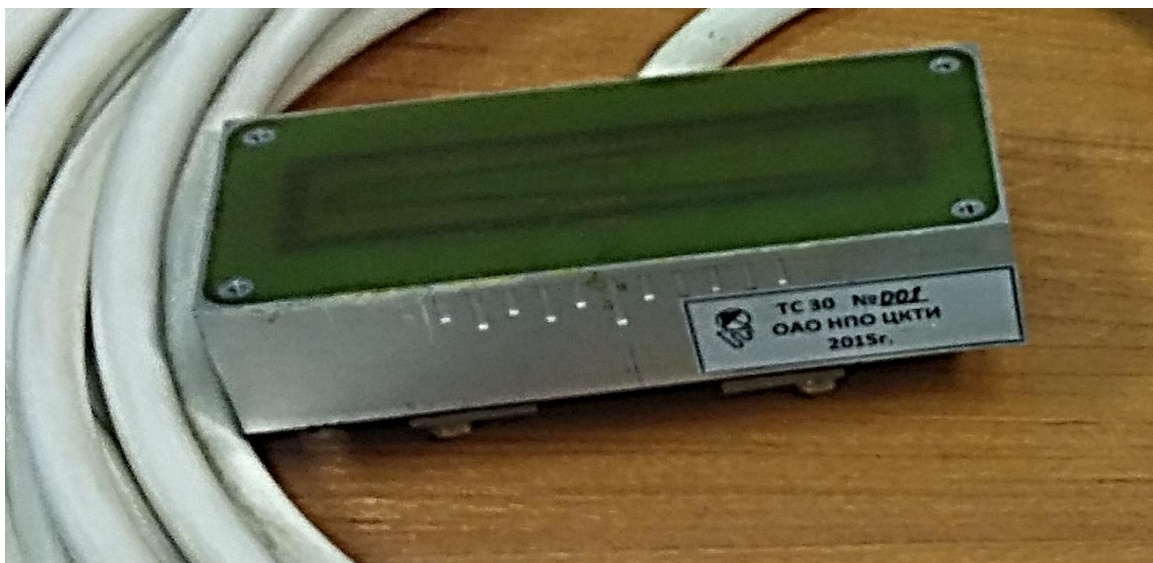
Рисунок 1 - Общий вид трансформатора смещения ТС30 с кабелем