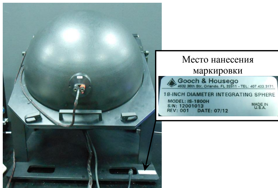
Рисунок 2 - Общий вид фотометрического шара OL IS-1800 с указанием места нанесения маркировки