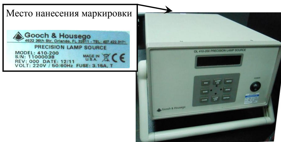
Рисунок 3 - Общий вид источника питания для эталонной и вспомогательной ламп OL410-200 с указанием места нанесения маркировки