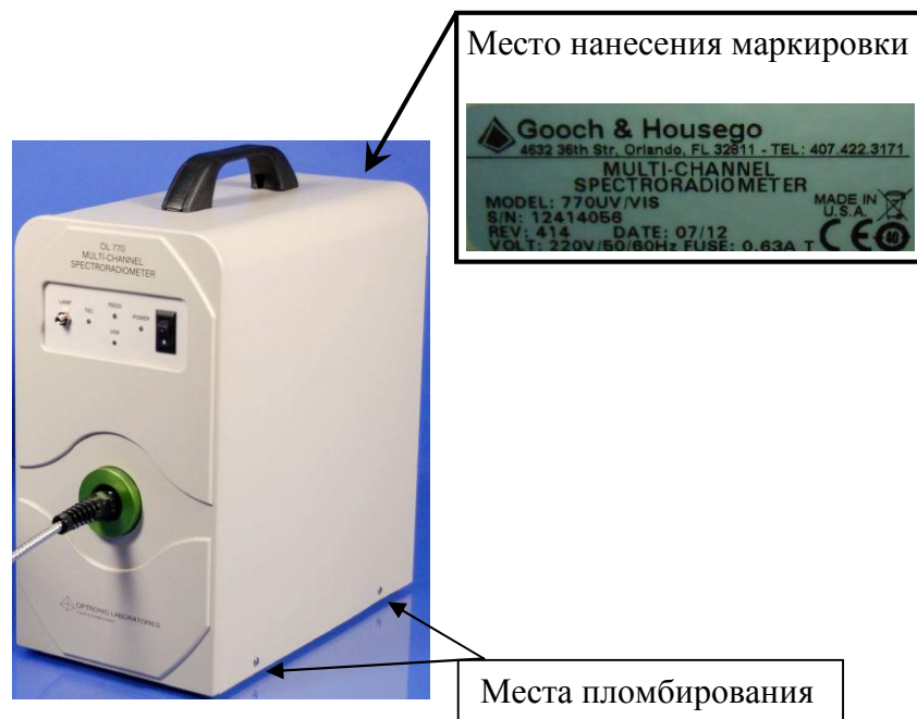
Рисунок 4 - Общий вид спектрорадиометра OL-770 UV/VIS с указанием мест пломбирования и нанесения маркировки