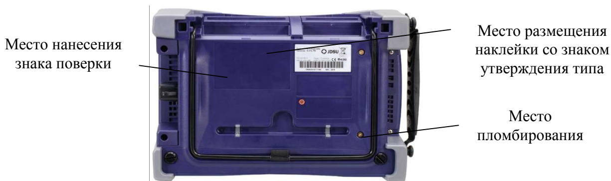
Рисунок 4 - Схема пломбировки от несанкционированного доступа, место размещения наклейки со знаком утверждения типа и знака поверки базового блока модификаций MTS-6000A, MTS-6000AV2