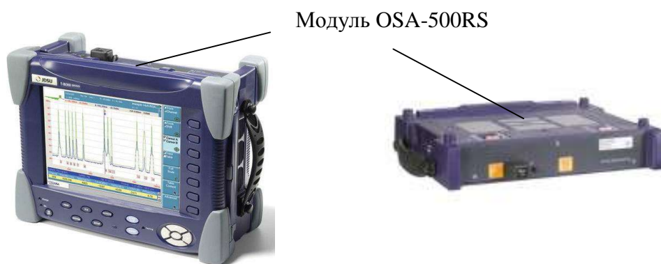
Рисунок 2 - Общий вид системы оптической измерительной MTS-8000E с модулем OSA-500RS