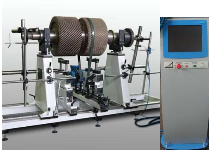
Рисунок 1 - Общий вид станка балансировочного виброизмерительного ВМВ 3000

Общий вид станка балансировочного ВМВ 3000 приведен на рисунке 1. Внешний вид приборной стойки представлен на рисунке 2.