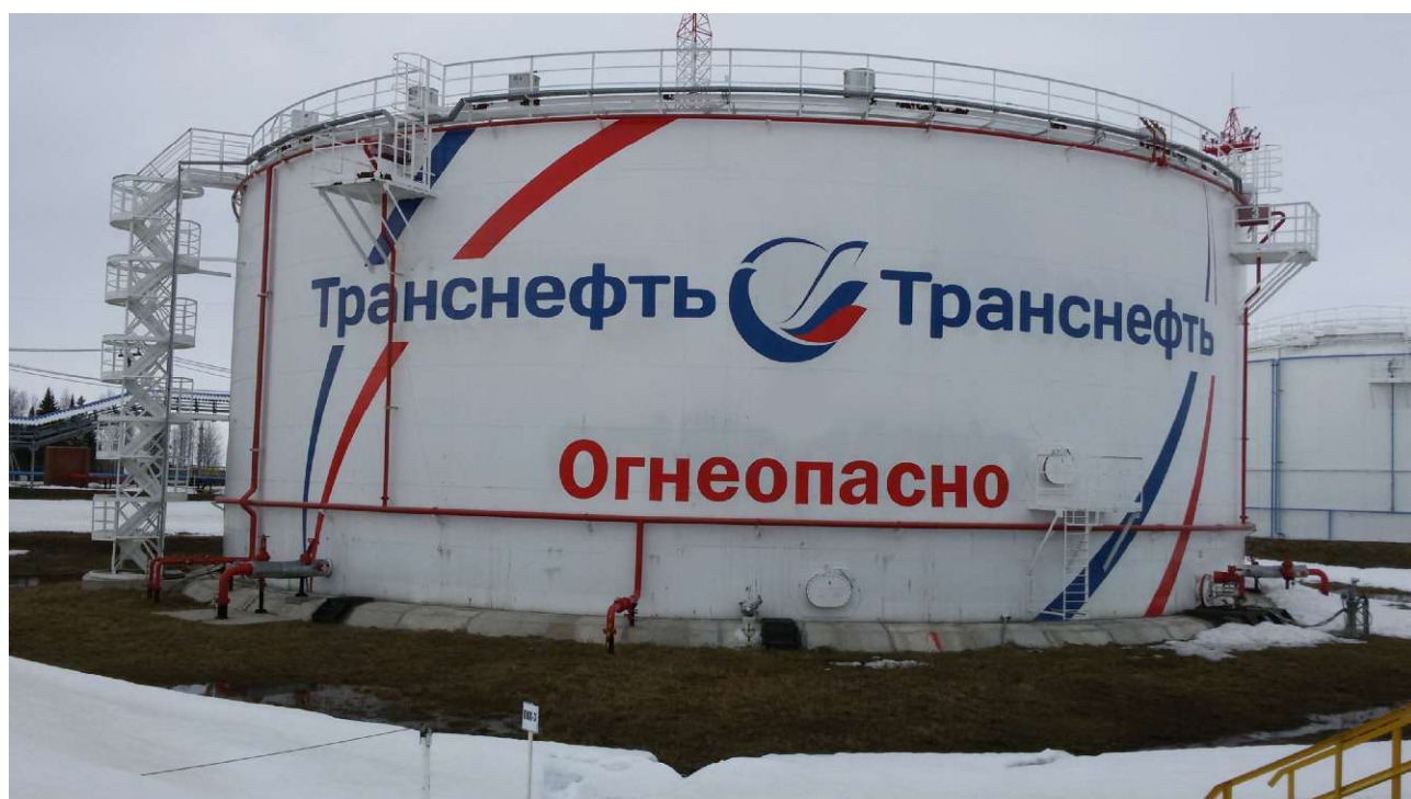
Рисунок 3 - Общий вид резервуара вертикального стального цилиндрического РВСП-10000