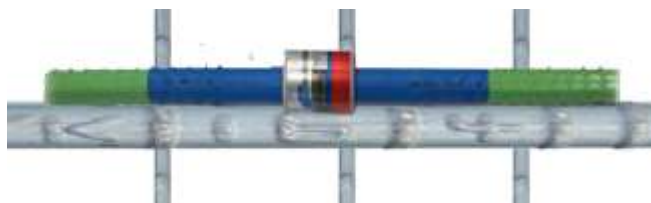
Рисунок 1 - Крепление датчиков к стержню рабочей арматуры

Также внутри тел датчиков находится термочувствительный элемент (термистор), позволяющий автоматически корректировать показания в зависимости от температуры окружающей среды.