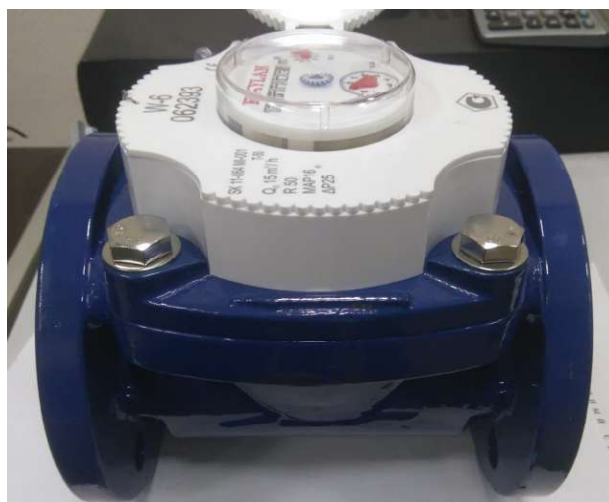
Рисунок 1 - Общий вид счетчиков холодной воды турбинных WOLTMANN

Схема пломбировки от несанкционированного доступа, обозначение места нанесения знака поверки представлены на рисунке 2.