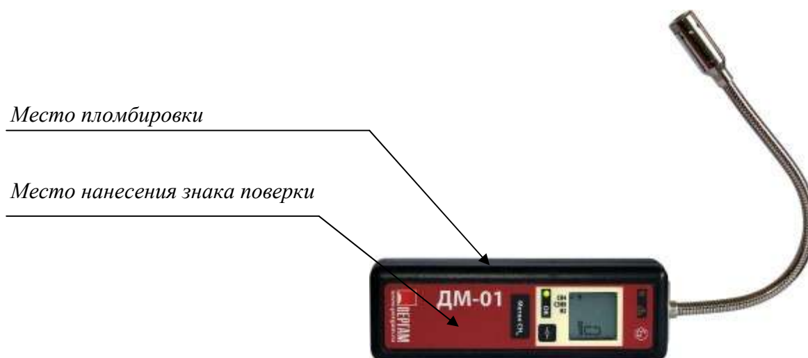
Рисунок 1 - Общий вид газоанализаторов электронных портативных модели ДМ-01

Газоанализаторы пломбируются голографической наклейкой на шов соединяющий половинки корпуса. Общий вид газоанализаторов представлен на рисунках 1, 2.