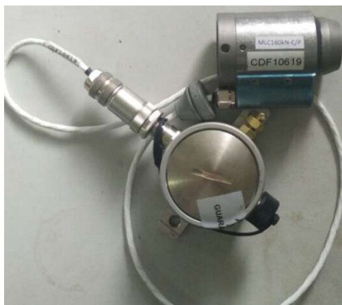
Рисунок 1 - Общий вид датчиков силоизмерительных тензорезисторных серии MLC160

Схема пломбировки от несанкционированного доступа, приведена на рисунке 2.