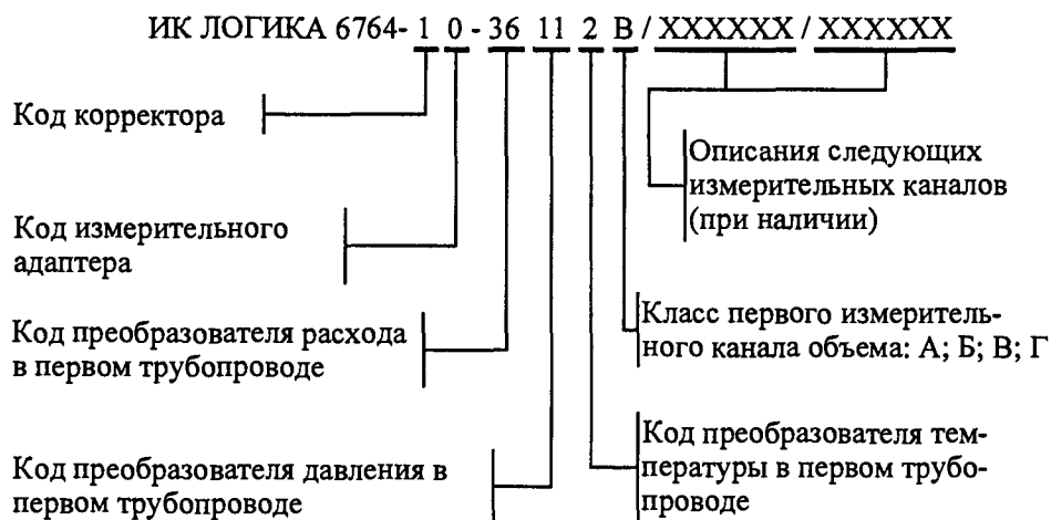
Рисунок 2.1 – Структура обозначения ИК

Структура обозначения ИК приведена на рисунке 2.1. Коды составных частей согласно таблице 2.1.