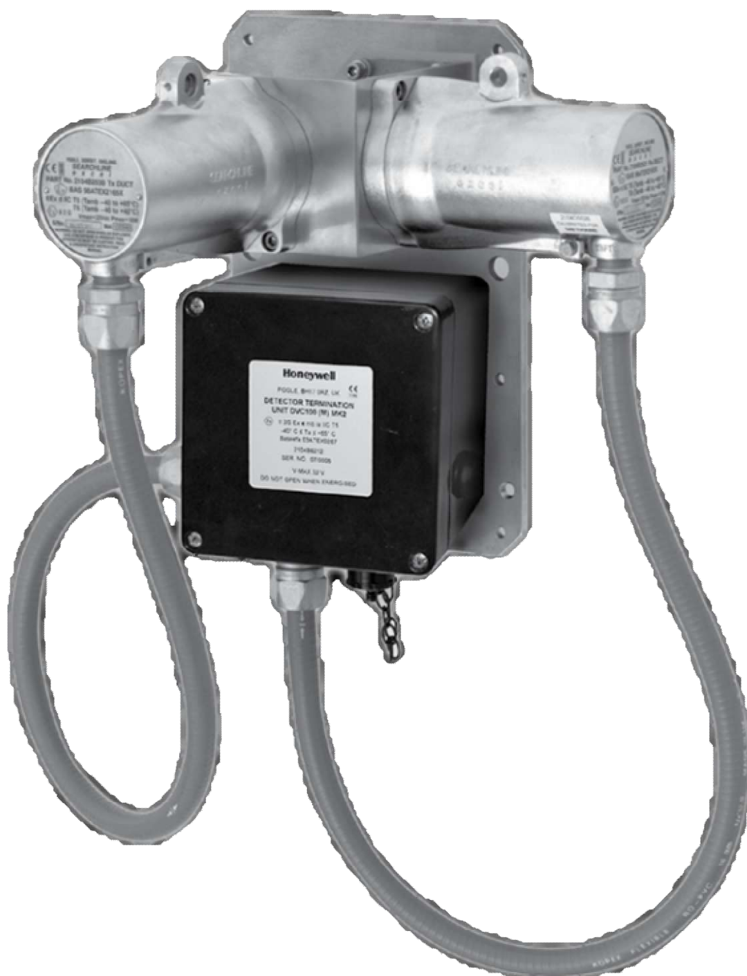
Рисунок 2 - Газоанализатор Searchline Excel XTC модели Cross Duct (без панели отражателя)