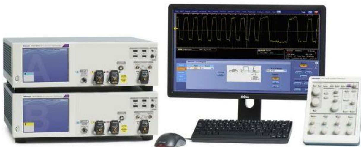
Рисунок 4 - Система из двух осциллографов с периферийными органами управления