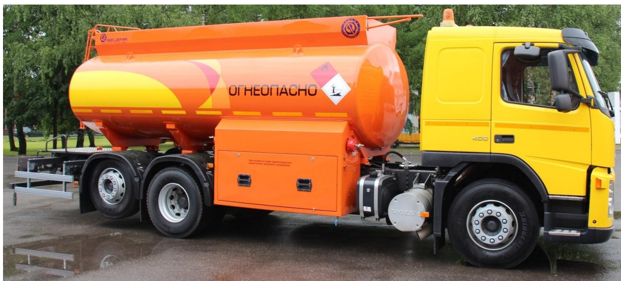
Рисунок 1 - Общий вид автоцистерны БЦМ-229 модель 56476-0000010-01

Схема пломбировки для защиты от несанкционированного изменения положения указателя уровня налива, обозначение места нанесения знака поверки представлены на рисунке 2.