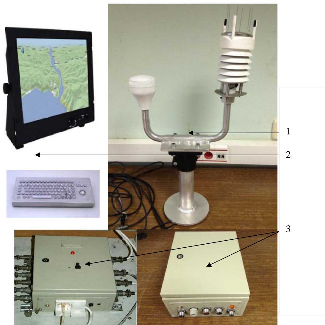
Рисунок 1 – Общий вид комплексов «Сюжет-КМ». 1 – модуль измерительный, 2 – модуль отображения и регистрации данных, 3 – модуль сбора и обработки данных.