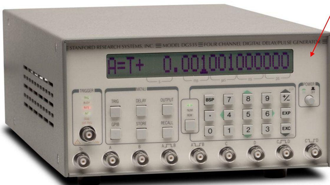
Рисунок 2 - Общий вид

место размещения знака утверждения типа и знака поверки