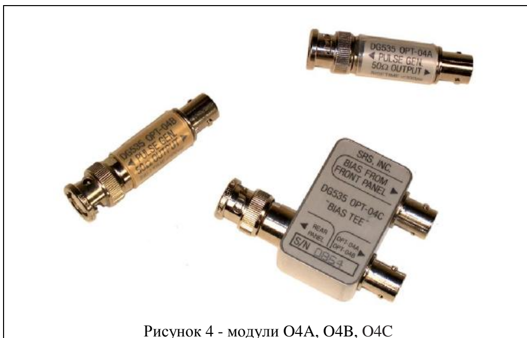
Рисунок 4 - модули O4A, O4B, O4C

По заказу могут быть поставлены показанные на рисунке 4 модули обострения фронтов (переднего фронта O4A и заднего фронта O4B), а также тройник смещения O4C для использования модулей обострения на мощных выходах задней панели.