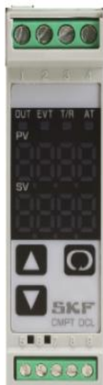
Рисунок 3 - Внешний вид дисплейного модуля СМРТ DCL

Внешний вид дисплейного модуля СМРТ DCL приведен на рисунке 3.