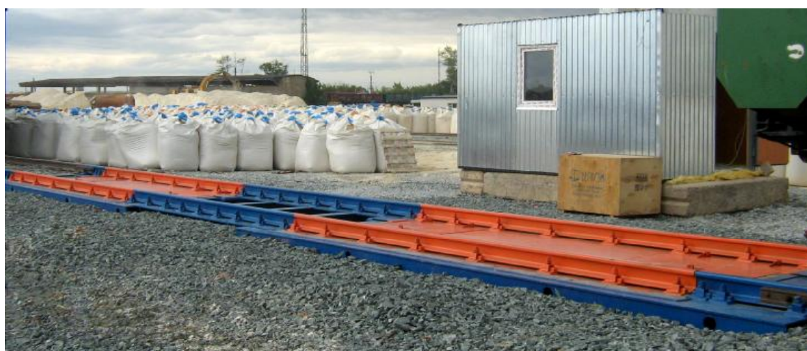
Рисунок 2 - Общий вид ГПУ с двумя взвешивающими секциями и вставкой для повагонного взвешивания (пример)