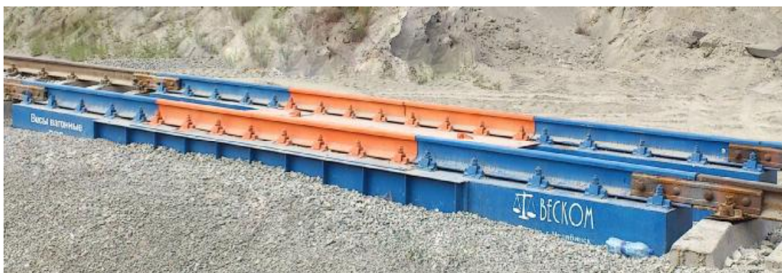
Рисунок 1 - Общий вид ГПУ с одной взвешивающей секцией для потележечного взвешивания (пример)

Внешний вид средства измерений представлен на рисунках 1 - 3.