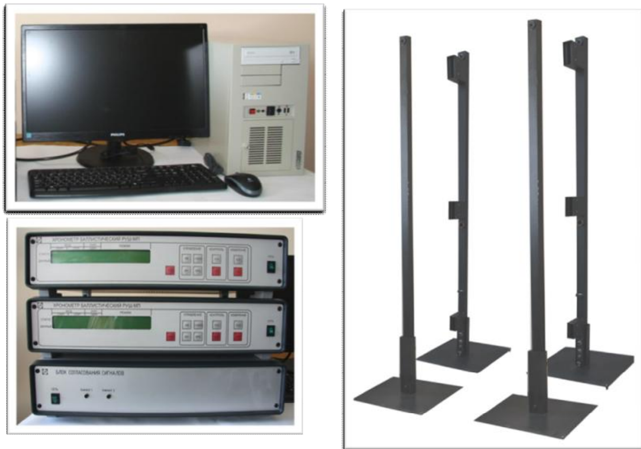
Рисунок 1 - Общий вид комплексов фотоэлектронных измерительных ФЭБ-4СМ