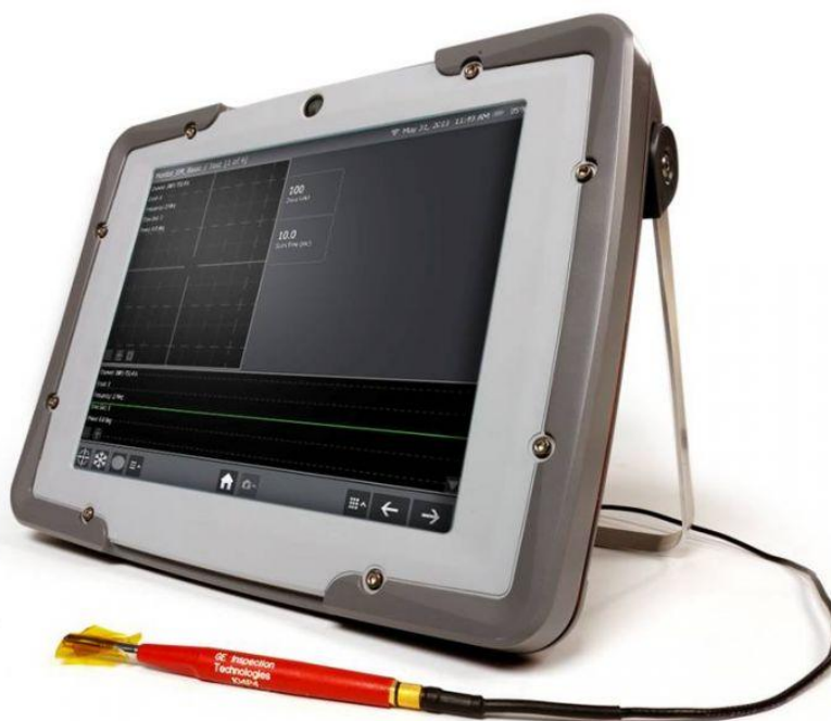
Рисунок 1 - Общий вид дефектоскопов

Общий вид дефектоскопов представлен на рисунке 1.