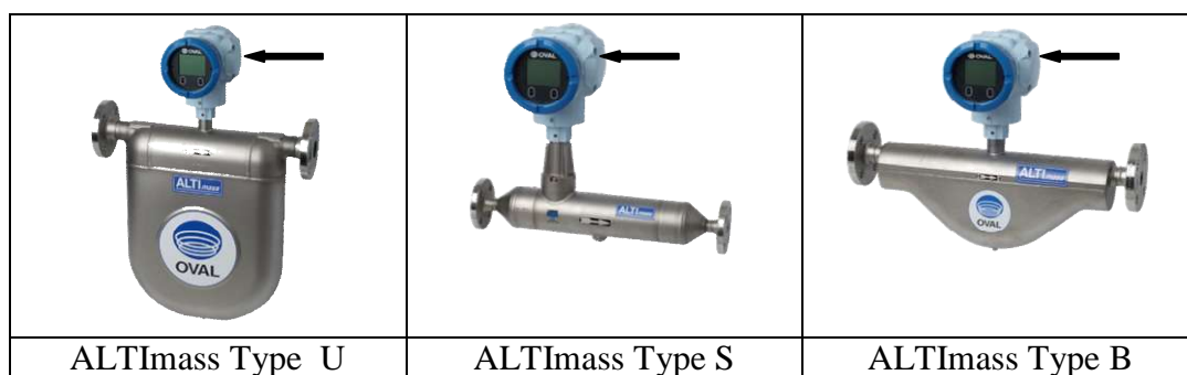
Рисунок 1 - Общий вид и место пломбирования счетчиков-расходомеров массовых кориолисовых OVAL модификаций ALTI mass Type U, ALTI mass Type S и ALTI mass Type B

Общий вид счетчиков-расходомеров массовых кориолисовых OVAL модификаций ALTI mass Type U, ALTI mass Type S, ALTI mass Type B приведен на рисунках 1 и 2.