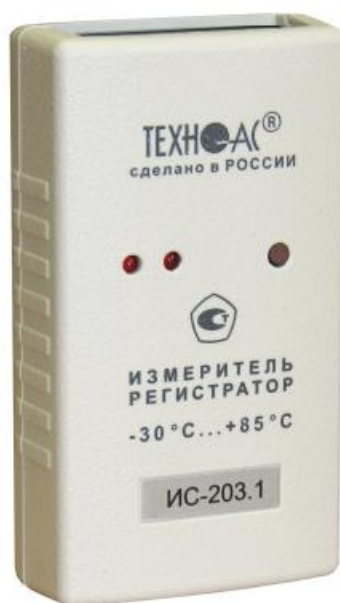
Рисунок 1 - Фотография общего вида прибора ИС-203.1.0 (1)