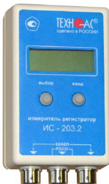
Рисунок 2 - Фотография общего вида прибора ИС-203.2