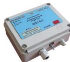
б) блок питания и связи