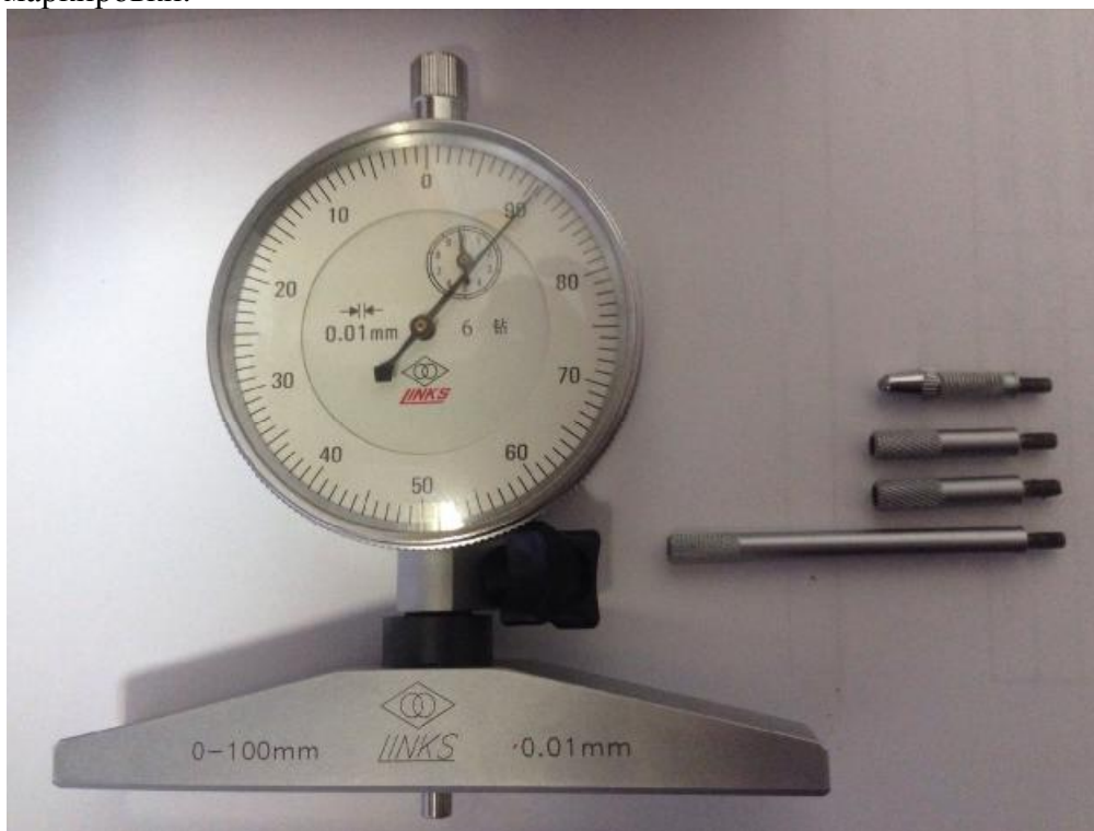
Рисунок 1 – Общий вид глубиномеров индикаторных серии 819