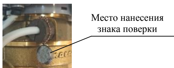
Рисунок 2 – Место нанесения знака поверки