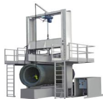
Рисунок 9 - Внешний вид машин для испытаний материалов TESTING 18.2001, 18.2002, 18.2003