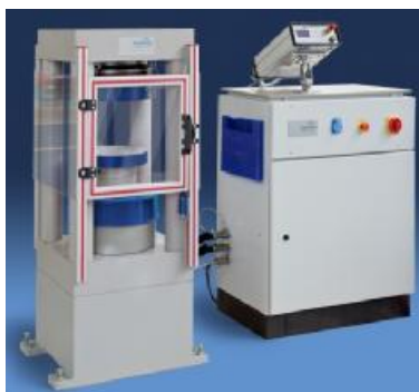
Рисунок 2 - Внешний вид машин для испытаний материалов TESTING 2.1100BS, 2.1100BH, 2.1101BS, 2.1101BH