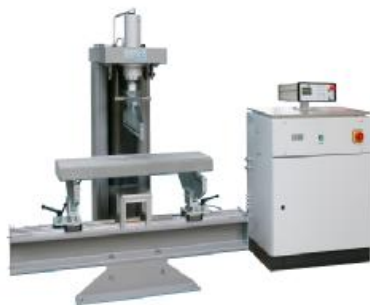
Рисунок 5 - Внешний вид машин для испытаний материалов TESTING 2.1074, 2.1075