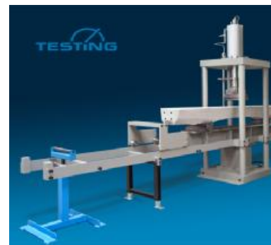
Рисунок 6 - Внешний вид машин для испытаний материалов TESTING 2.1290, 2.1301