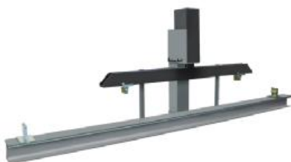
Рисунок 10 - Внешний вид машин для испытаний материалов TESTING 18.4001