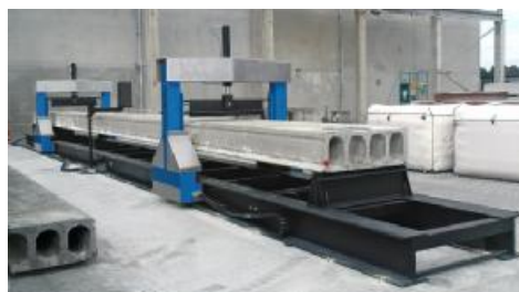
Рисунок 11 - Внешний вид машин для испытаний материалов TESTING 18.6001

Для ограничения доступа к определённым частям в целях несанкционированной настройки и вмешательства производится установка металлической пломбы на регулятор давления насоса машины.