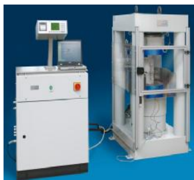
Рисунок 7 - Внешний вид машин для испытаний материалов TESTING 2.1130, 2.1160