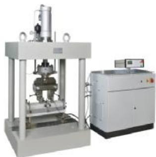
Рисунок 4 - Внешний вид машин для испытаний материалов TESTING 2.1080B