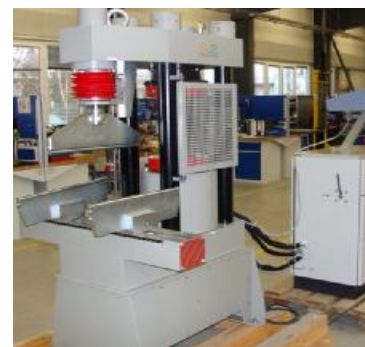
Рисунок 3 - Внешний вид машин для испытаний материалов TESTING 2.1089, 2.1099