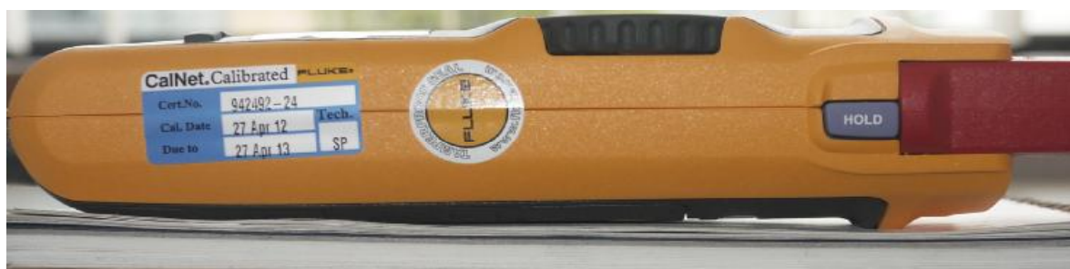
Рисунок 2 - Место пломбирования от несанкционированного доступа

Схема пломбирования клещей от несанкционированного доступа показана на рисунке 2.