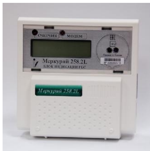
Рисунок 2 - Внешний вид блока индикации PLC

Внешний вид блока индикации PLC приведён на рисунке 2.