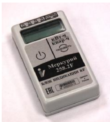
Рисунок 3 - Внешний вид блока индикации RF

Внешний вид блока индикации RF приведён на рисунке 3.