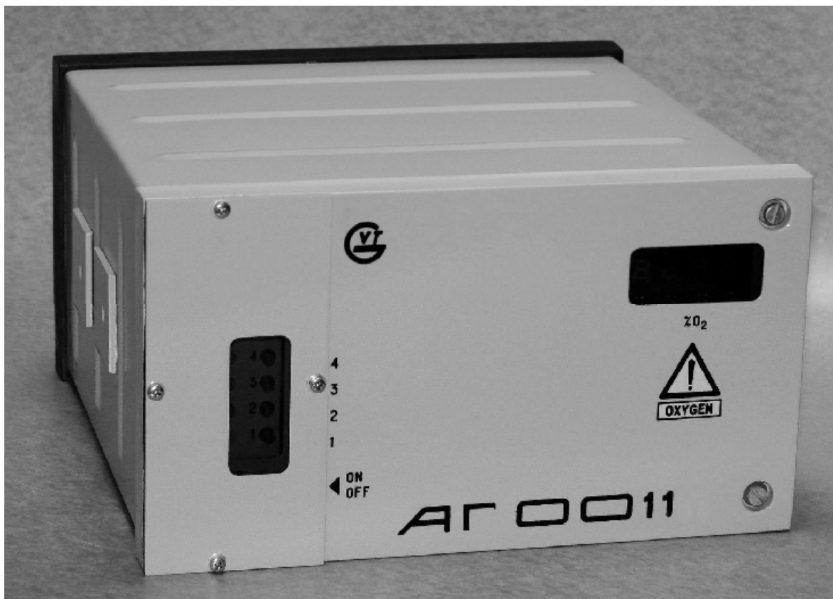
Рисунок 1 – Газоанализатор АГ 0011, внешний вид