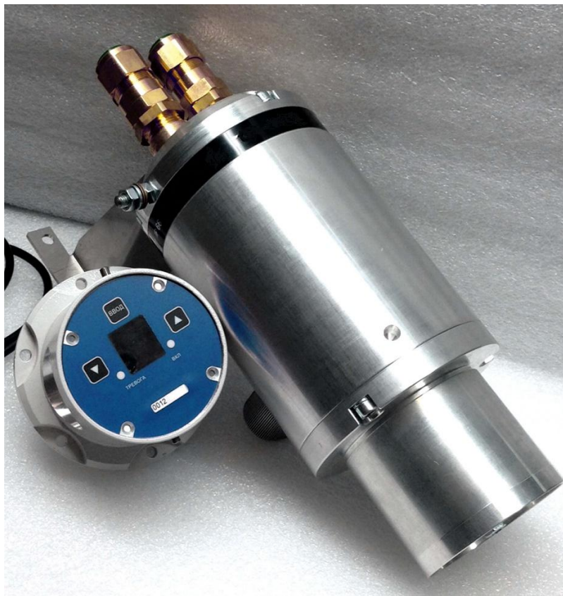
Рисунок 2 - Внешний вид газоанализатора А-Тогаз G201

Выбранная схема исключает возможность несанкционированного изменение аппаратного или программного обеспечения газоанализатора.