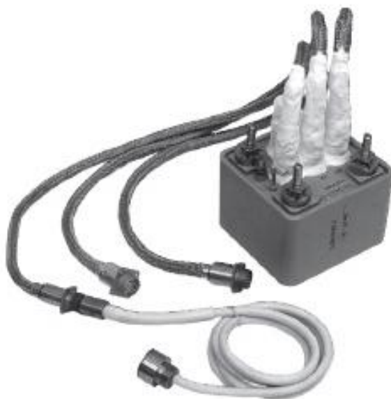
Рисунок 1 - Общий вид системы

Общий вид систем приведен на рисунке 1, габаритные и установочные размеры на рисунке 2.