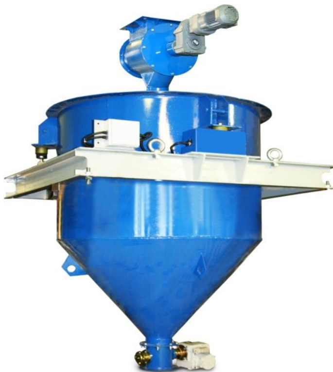
Рисунок 1 – Весовой бункер дозатора

Внешний вид весового бункера дозаторов представлен на рисунке 1.