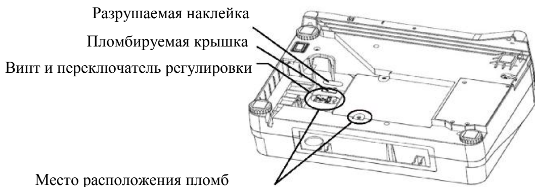
Рисунок 2 — Схема пломбировки от несанкционированного доступа

Схема пломбировки от несанкционированного доступа, обозначение места нанесения знака поверки представлены на рисунках 2 и 3.