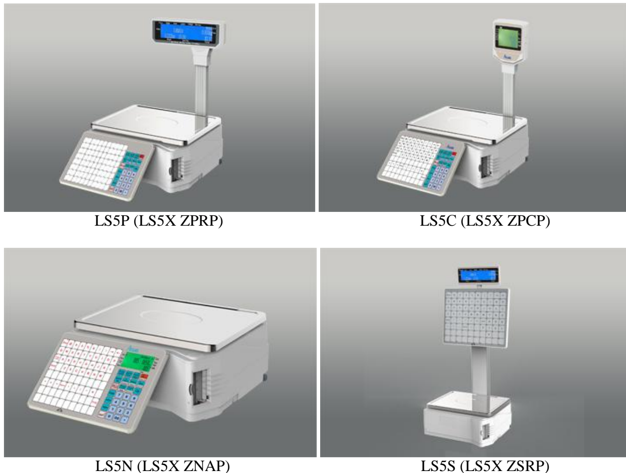
Рисунок 1 — Общий вид средства измерений

Внешний вид средства измерений представлен на рисунке 1.