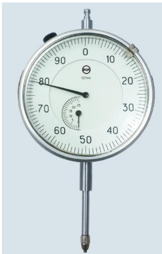
Рисунок 4 - Общий вид индикаторов часового типа с диапазоном измерений от 0 до 25 мм