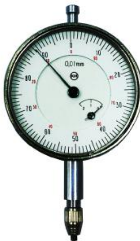
Рисунок 1 - Общий вид индикаторов часового типа с диапазоном измерений от 0 до 2 мм