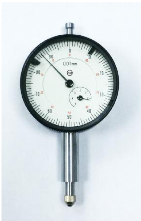
Рисунок 2 - Общий вид индикаторов часового типа с диапазоном измерений от 0 до 5 мм