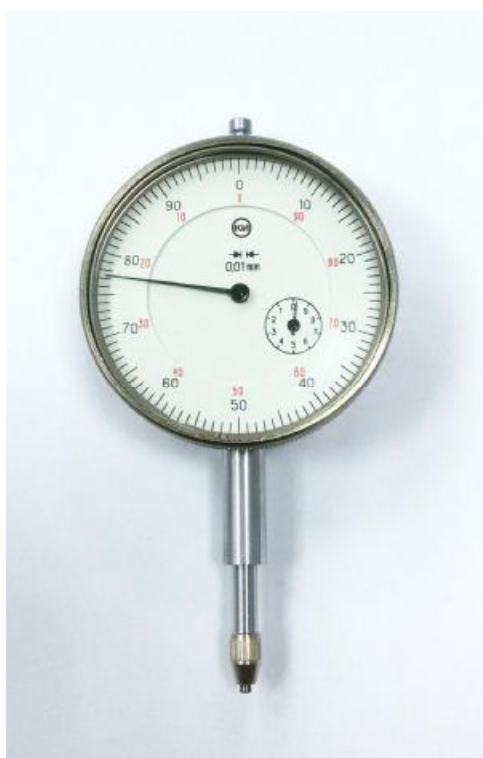
Рисунок 3 - Общий вид индикаторов часового типа с диапазоном измерений от 0 до 10 мм