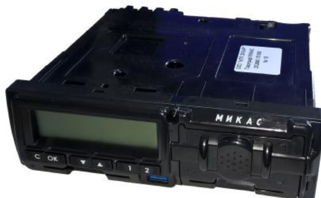
Рисунок 1 – Общий вид тахографа

Внешний вид тахографов приведен на рисунках 1, 2. На рисунке 2 приведены схема пломбировки тахографов от несанкционированного доступа и место нанесения знака утверждения типа.