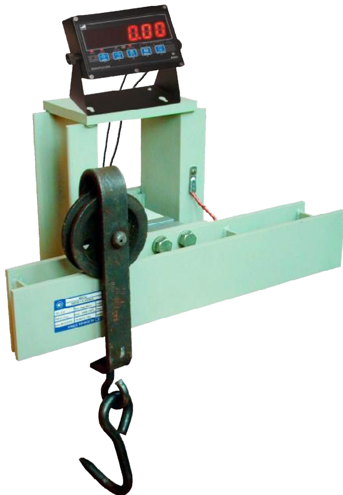
Рисунок 1 – Вид модификации М8700-1

Общий вид весов показан на рисунках 1 – 2.