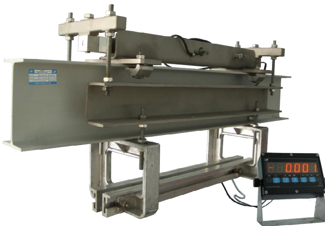
Рисунок 2 – Вид модификации М8700-2

Ограничение доступа к узлам регулирования, влияющим на метрологические характеристики весов, осуществляется защитной пломбой, с нанесенным знаком поверки, размещенной на терминале, как показано на рисунке 3.