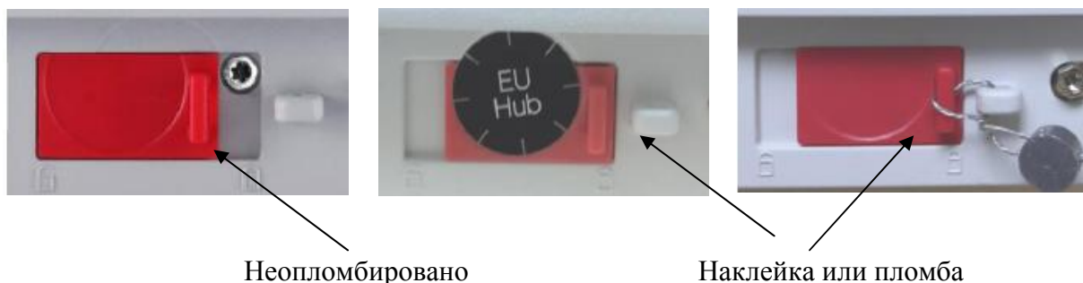
Схема пломбировки весов от несанкционированного доступа приведена на рис. 3.